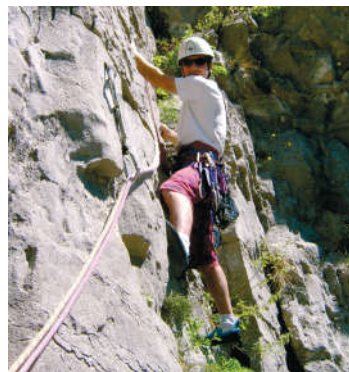
Die letzte schwere Stelle vor dem Ausstieg.

Früh aufstehen oder bei sicherem Wetter am Nachmittag einsteigen.