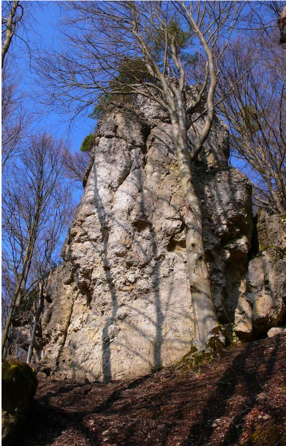
| Der Frankenzirkus.