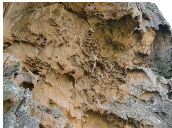
| Die „Tafoni-Höhle“.

Vom letzten Stand kurz unter dem Gipfel 3 x 50 m abseilen. Durch dichtes Unterholz gelangt man nach ca. 100 m zurück zum Einstieg (20 Min.). Wie bekannt in 30 Min. zurück zum Parkplatz.